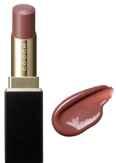
06 花朧 HANAOBORO