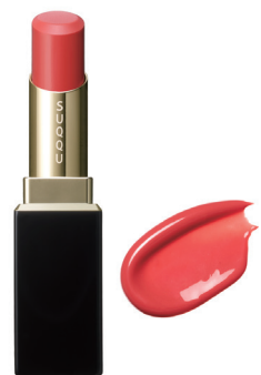
03 戀紬 KOITSUMUGI