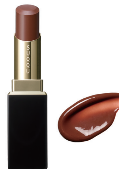
09 深響色 MIHIBIKIIRO