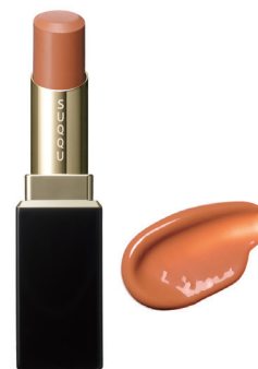
04 艶蜜果 TSUYAMITSUKA