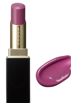
05 耀紫 YOUYUKARI