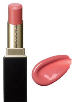
02 儂咲 HAKANAZAKI