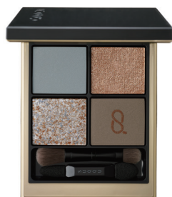
135 日向織 -HINATAORI [ 限定色 ]

（艷燦雪利酒色 × 經典淺紫色） 這款眼影盤演繹了倒映於水面的美麗櫻花景色。 春意融融的柔和色彩中添加了少許暗色調。 顯色的艷燦玫瑰色，塑造華美的印象。