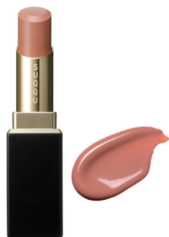
01 陽風 HINATAKAZE