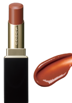
08 木漏光 KOMOREBIKARI