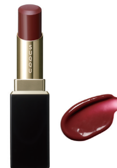
10 焦紅 KOGAREAKA