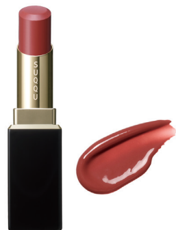
07 色香差 IROKASASHI