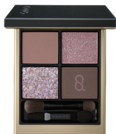
134 櫻鏡 -SAKURAUTSUSHI [ 限定色 ]

（艷燦雪利酒色 × 經典淺紫色） 這款眼影盤演繹了倒映於水面的美麗櫻花景色。 春意融融的柔和色彩中添加了少許暗色調。 顯色的艷燦玫瑰色，塑造華美的印象。