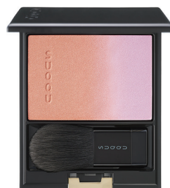
147 春便 -HARUTAYORI [ 限定色 ]

表現了櫻花瓣漂浮在水面上的意境。 用略微泛黃的粉色柔和裝點雙頰， 在淡藍色的高光色中添加了粉色珠光， 如同溶化般自然融入肌膚。