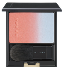
146 花卉浮 -HANABIRAUKABE [ 限定色 ]

表現了櫻花瓣漂浮在水面上的意境。 用略微泛黃的粉色柔和裝點雙頰， 在淡藍色的高光色中添加了粉色珠光， 如同溶化般自然融入肌膚。